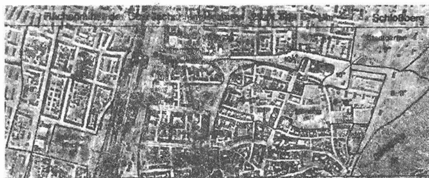
Fig. 4. Imagen infrarroja de "line-scanner" de la parte norte del núcleo de Freiburg. División de la ciudad en las partes de estructura de cuerpo de construcción y temperatura superficial más uniformes. Notoria es la diferencia térmica entre la antigua parte sur estrechamente construida y la parte norte, reconstruida en post-guerra en forma más abierta. (En: WEISCHET, W. 1975. Stadtklimatologische Konsequenzen von Line-Scanner-Aufnahmen der Oberflächentemperaturen im Tagesgang. Beispiel Freiburg i. Br. Symp. Erdekundung. DFVLR. DGP. Köln-Porz: 459-467).

mente recomendable en investigaciones completas de clima regional, subregional o local.